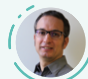
Régis Cara Comptabilité