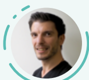
Philippe Baccara Développement informatique